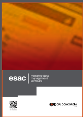
ESAC - Metering data management software