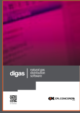
DIGAS - Natural gas distribution software