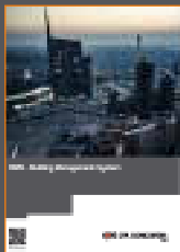
BMS - Building Management System