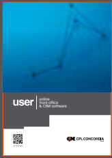
USER - Online front office and CRM software