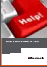
Servizio di Pronto Intervento per le Utilities